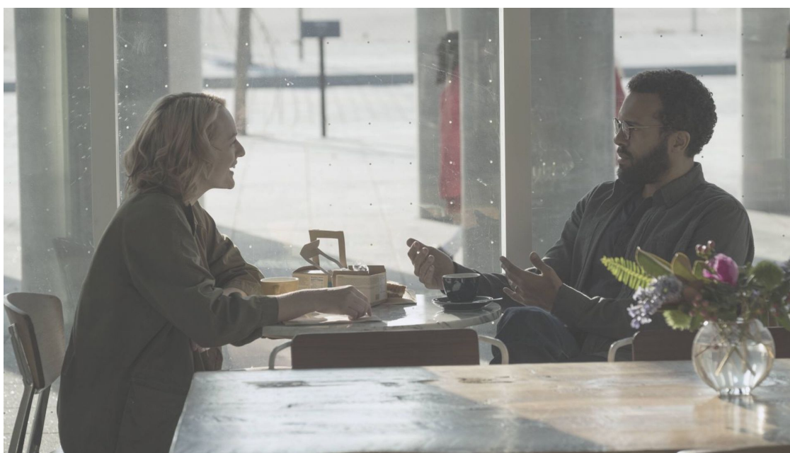
Scene flešbekova iz serije "The Handmaid's Tale", 2. sezona, 5. epizoda (2017), Bruce Miller i dr.

Eisenstein) i Majkla Mura (Michael Moore) kao njegove najvažnije uticaje (poslednjepomenuti je prikazao njegov anti-trampovski film Farenhajt 11/9 (Fahrenheit 11/9) u skoro isto vreme kada je Benon prikazao njegov pro-trampovski film Tramp u ratu (Trump@War), a obojca su se tako uključila u propagandnu trku uoči ključnih prelaznih izbora u SAD). 14 Benonov „kinetički“ estetički rečnik se sastoji od brzo izmontiranih sekvenci sa komentarima raznih „eksperata“ koji pružaju narativu strukturu. Gledaoci su bombardovani tematski organizovanim arhivskim snimcima i uzbudljivom muzikom. Slike životinja predatora, kao što su ajkule, oličavaju podzemne ekonomske snage koje svakog trenutka mogu da izrone u stvarnost, dok zapaljene novčanice – koje se pojavljuju u skoro svakom Benonovom filmu – predstavljaju pretvaranje duhovnih vrednosti u dim unutar društva koje se bliži svom četvrtom turnusu. „Ono što sam pokušao da uradim je da načinim film oružjem“, tvrdi Benon. 15 Njegovi filmovi konstruišu „vladajući narativ“ koji legitimizuje autoritarnu vlast snažnih vođa koji se suočavaju sa neprestanim pretnjama višeglave Zveri. 16 Ovaj vladajući narativ takođe određuje ko spada, unutar Bannonovog zastrašujućeg pogleda na svet, u „nas“, a ko pripada „njima“ – ko se bori protiv Zveri, a ko joj udovoljava ili, pak, služi.