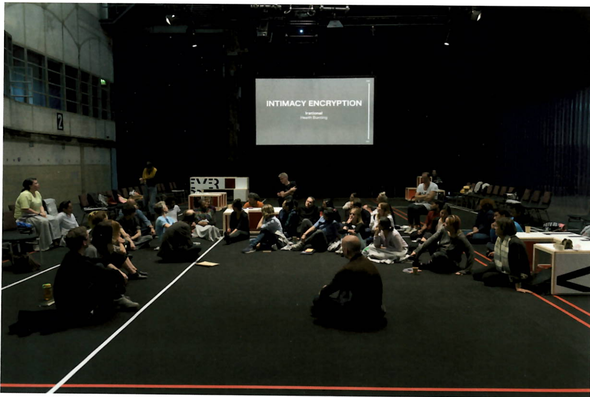
Jonas Staal, Training for the Future , 2019 20. bis 22. September 2019, Ruhrtriennale, Bochum