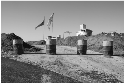
Jonas Staal, uit de reeks Anatomy of a Revolution—Rojava , 2014. Toegang tot een trainingskamp van de People's Defense Forces (YPG) en de Women's Defense Forces (YPJ) vlak na de grensovergang van Iraakes Koerdistan naar het autonome kanton Cizîre in Syrisch Koerdistan.

van het machtsvacuüm dat in 2012 in het noorden van Syrië ontstond door de burgeroorlog.