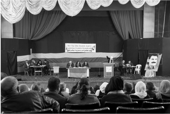
Jonas Staal, uit de reeks Anatomy of a Revolution—Rojava , 2014. Kandidaten uit buurtleden en coöperatieven stellen zich voor om tot co-president te worden verkozen van de People’s Council van de stad Kamishli.

nieuwe monumenten voor de revolutie brengen een nieuw geheugen in het publieke domein; een nieuw bewustzijn middels hen die zich – zoals Botan zei – ‘opvoeren’ op het slagveld. Een collectief lichaam dat zich herschrijft in de geschiedenis – jarenlang bloedig gewist, onderdrukt, op de zwarte lijsten van de wereld geplaatst – en dat nu een radicaal nieuw heden tot uitdrukking brengt.