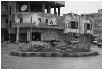
Jonas Staal, uit de reeks Anatomy of a Revolution—Rojava , 2014. Een oude fontein van het bewind van Assad in Kamishli is omgewerkt tot een monument voor de Revolutie van Rojava, in geel-rood-groen en met een aantal martelaarsportretten van overleden revolutionairen.

In het gasthuis van de Democratische Eenheidspartij (PYD), een van de drijvende krachten achter de Revolutie van Rojava, zie ik Botan verschijnen in een muziekvideo op Rohani TV, het media-kanaal van de beweging, dat permanent aanstaat in de woonkamer. De muziekvideo bestaat uit een doorlopende collage van strijders van de Koerdische Arbeiderspartij (PKK), de gerelateerde Volksbeschermingseenheden (YPG) en Vrouwenbeschermingseenheden (YPJ) van Rojava, omringd door zangers in Koerdische klederdracht. Hier voeren muzikant en soldaat zichzelf inderdaad gezamenlijk op. Het doet mij denken aan vroege mediareportages van de strijd, waarin beschreven werd hoe Koerdische strijders zingend naar de frontlinie vertrokken.