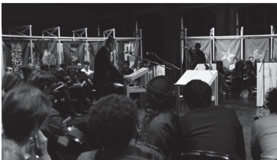
New World Summit – Berlijn, 2012 Jonas Staal Overzicht ‘alternatieve parlement’ New World Summit in Sophiensaale Berlijn, ontwerp i.s.m. Paul Kuipers