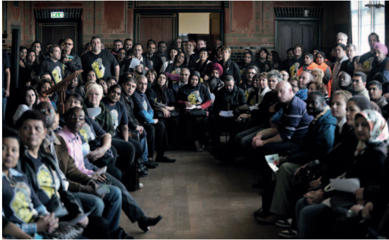
Het parlement van schoonmakers in De Burcht in Amsterdam

zich krachtiger verhoudt tot de kwesties die nu leven in Nederland.'