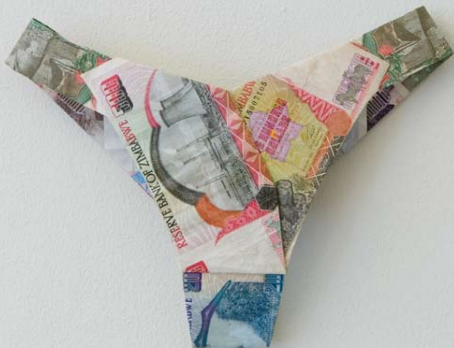
Zim Style (detail), Sanne Avenhuis, Collectie GroenLinks