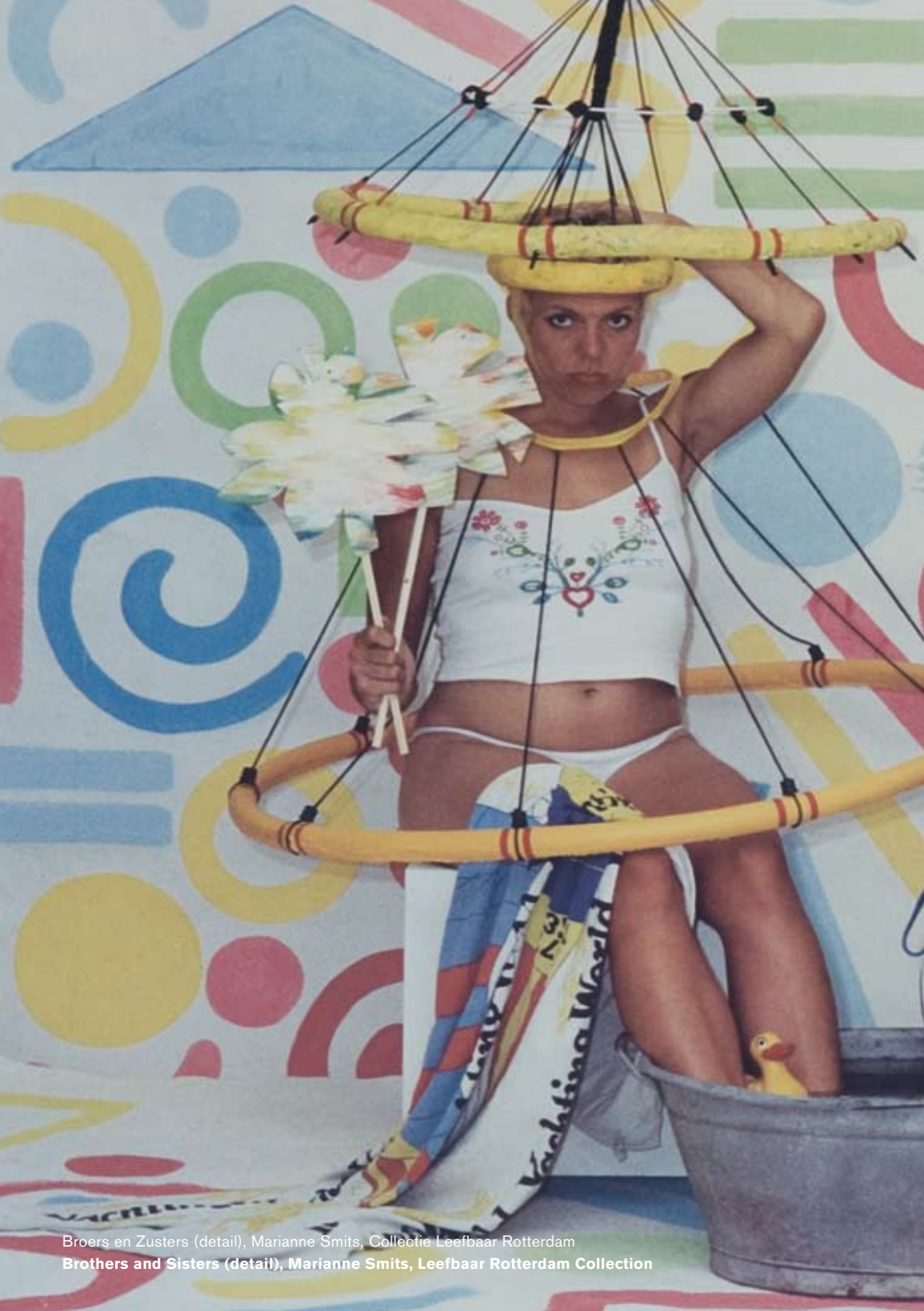
Broers en Zusters (detail), Marianne Smits, Collectie Leefbaar Rotterdam